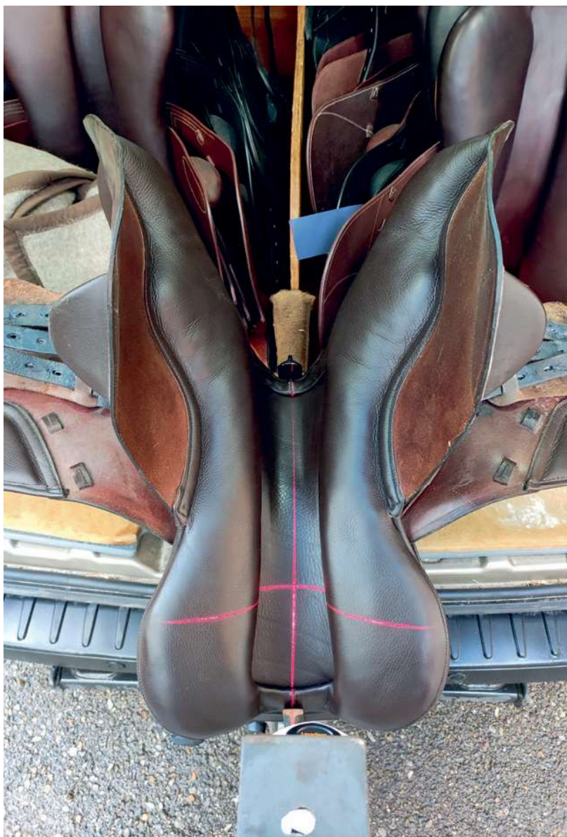
Kontrolle vor Ort mit Hilfe eines Lasers, um die Symmetrie des Sattels zu kontrollieren.

Sattler ist ein Beruf, der mehr und mehr von der Bildfläche verschwindet. Wer Pferde hält und reitet oder fährt, weiss, wie wichtig qualitativ hochwertiges Ledermaterial ist. In einer kleinen Serie werden Sattelbetriebe in der Schweiz vorgestellt, welche dem Verband Leder Textil Schweiz VLTS angeschlossen sind. In dieser Folge stellt «Kavallo» die Ruedi Gerber Reit- und Fahrsportsattlerei vor.